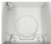
Camera a vuoto ultra resistente