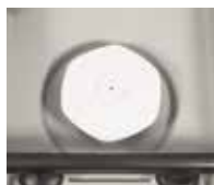
Fondo per contenitori