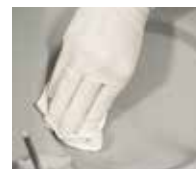
Pulizia della camera sempre perfetta