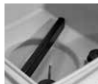
Barra saldante amovibile senza utensili