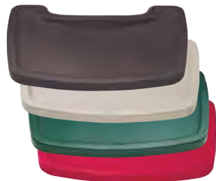
FG781588 Vassoio Sturdy Chair™ disponibili in platino, verde scuro, rosso e nero.