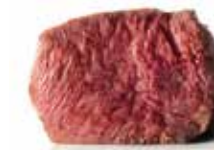
COTTURA "SOUS VIDE"