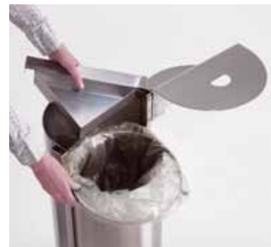
Particolare dell'anello reggi-sacchetto