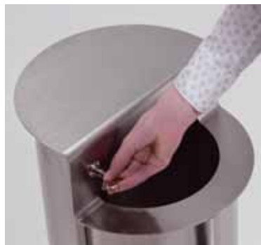
Particolare della serratura