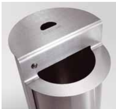
Particolare del coperchio/posacenere