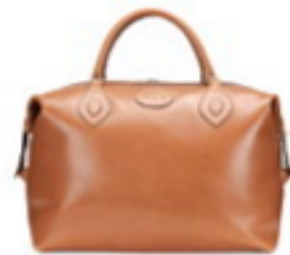
In the bag Medium weekend bag with personalised initials £400, Testing , testing.co.uk