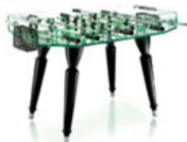
On the ball Football table, Tockell available at Harrods