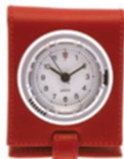
Keeping time Travel clock, £30, Eringer eringer.co.uk