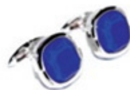
Off the cuff Crystal haze cufflinks, £3,400 Stephen Webster , 93 Mount Street, W1K 2SY 0845 539 1840, stephenwebster.com