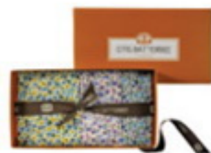
Flower power Primrose floral pocket squares, £35 Oris Butterbee , stocked at Liberty, Harrods and Fortnum & Mason

Great ideas for the perfect gent's present