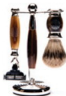
Clean shave Mylar hair set, £150, Gentlemen's Tonic gentlemenstonic.co.uk