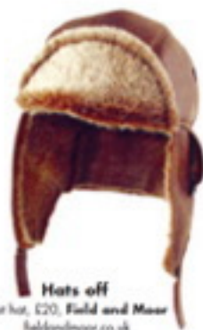
Hats off Pile hot, £20, Field and Moor fieldandmoor.co.uk