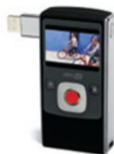
Lights, camera, action Flip Ultra HD camcorder, £190, available from Gift Library, giftlibrary.com