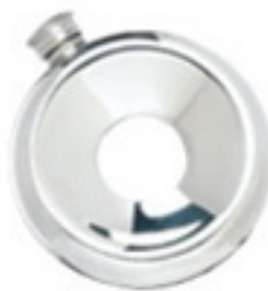
A wee dram Pewee hole in one flask, £40, Inkerman by appointment 2 Unbridge Street, W9 7SY inkerman.co.uk